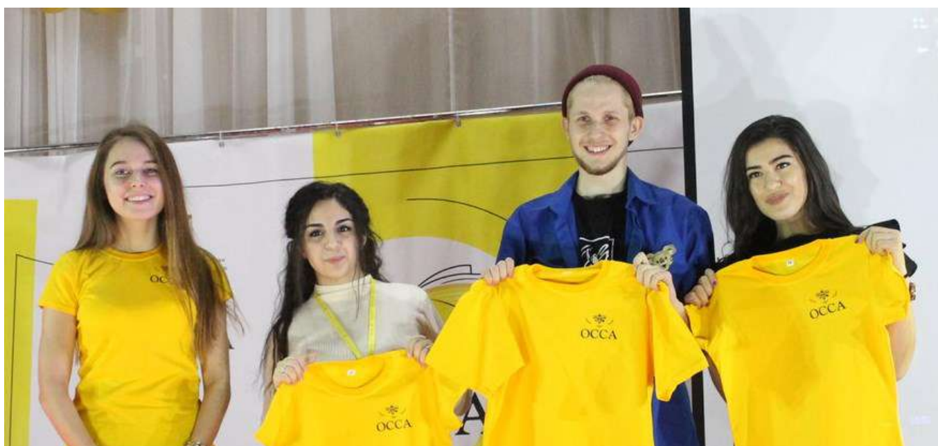
Мери представляет студентов колледжа на областных и городских мероприятиях

Знакомим с ребятами, которых выбрали в профсоюзный комитет студентов.